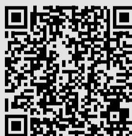
YouTube-Video PTK 1000

Wenn man der Stammpilot von so einem Gerät ist, ist man schon stolz. Selbstverständlich steckt auch sehr viel Verantwortung dahinter. Deshalb sind natürlich die Anforderungen groß. Man muss einmal ein Top-Autofahrer sein, sonst kann man mit diesem Gerät gar nicht auf der Straße fahren. Dann braucht man ein irr sinniges Gefühl für den Kran selbst, und auch ein gutes technisches Verständnis. Man fährt mit dem – sozusagen nackten – Gerät auf die Baustelle und dort wird erst zusammengebaut. Auch dafür, dass der Kran richtig gerüstet wird, ist der Kranfahrer – in diesem Fall also ich – verantwortlich. Der Respekt vor diesem neuen, riesigen Kran ist da. Aber bei dieser Arbeit darf man ohnehin den Respekt nicht verlieren. Da ist jede Baustelle anders, obwohl man immer mit dem gleichen Gerät hinfährt, es sind immer unterschiedliche Situationen. Das darf einfach nicht zur Routine werden. Man muss sehr wohl zweimal, in vielen Fällen auch öfter überlegen, wie man Aufgaben am besten löst. Diesen tollen Job habe ich bekommen, weil ich große Erfahrung auf diesem Gebiet habe. Mittlerweile bin ich schon 34 Jahre bei Prangl. Ich freue mich über das Vertrauen, das unser Chef in mich setzt.